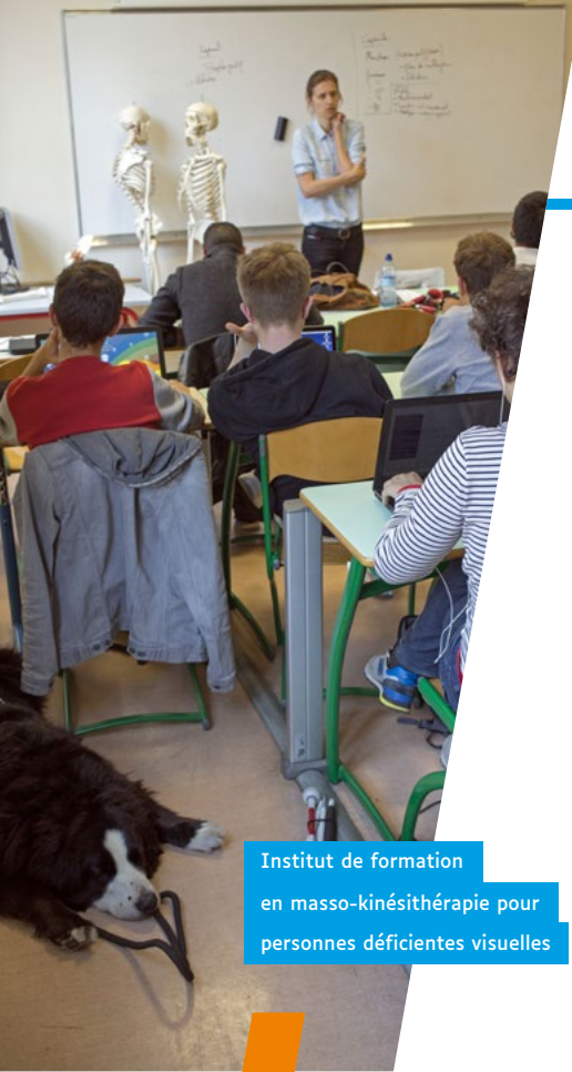
Institut de formation en masso-kinésithérapie pour personnes déficientes visuelles

Cela implique notamment, l'inscription des pratiques professionnelles dans une démarche qui rend effectifs les parcours inclusifs des jeunes accompagnés. Cette conception d'une démarche inclusive articule trois composantes : « processus volontariste », « volonté de mouvement » et « adaptations ».