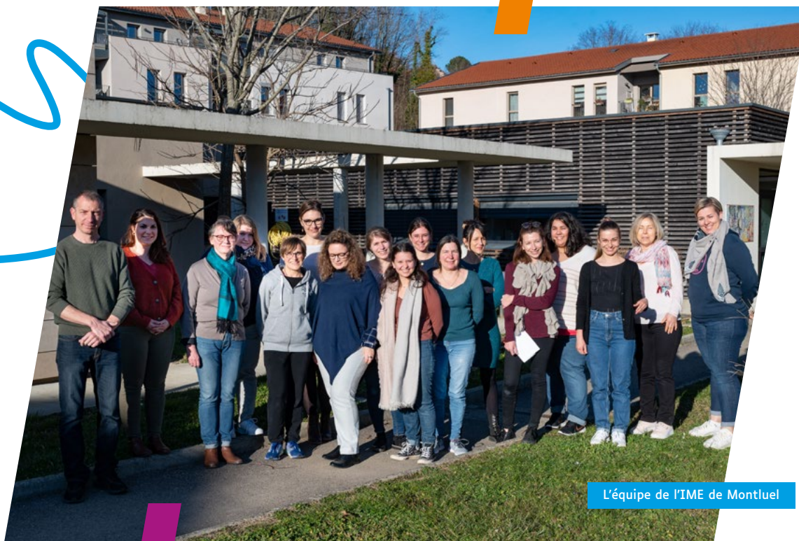
L'équipe de l'IME de Montluel